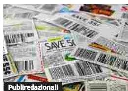
Publiredazionall Buoni sconto, almeno loro!