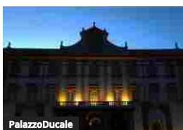
PalazzoDucale Il 1 Luglio Palazzo Ducale visitabile gratuitamente