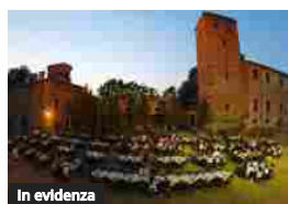
In evidenza Tornano le "Serate a Corte", sino al 4 agosto alla Corte del Castello di Montegibbio